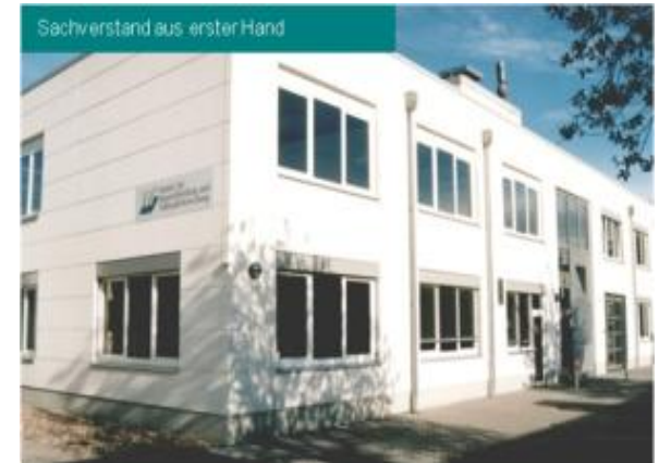
Von Sachverständigen für Sachverständige!